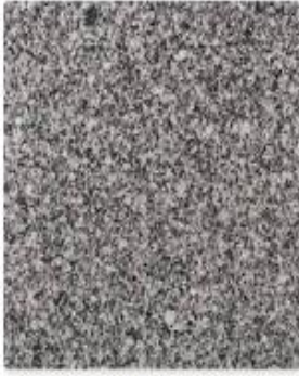
Bergama gri granit

Özellikle madencilik sektörü içinde anılan, mermer ve doğal taşlar başlığı altında incelenen granit, intrüzif magmatik bir kayadır. Genel mineralojik yapısı; alkali % 30-65, (<30 Na-zengin) plajiyoklaz <% 30, kuvars % 15-40 ve koyu (mafik) biyotitden (% 10) oluşmaktadır. Granit holokristalin ve taneli bir yapıya sahiptir. Tüm mermer ve doğal taşlarda olduğu gibi granitte de esas ayırt edici faktör renk ve dokudur. Aşağıda görüntüleri yer alan ürünlerin isimlendirmelerinde görüldüğü gibi İzmir ili Bergama ilçesi Kozak Yaylası'ndan elde edilen granitlerin renk ve dokuları Bergama Granitini diğer granit ürünlerinden ayırmakta ve tercih edilmesindeki asıl sebebi oluşturmaktadır.