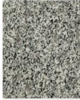
Hisar gri yaylak granit