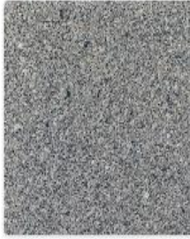
Hirfanlı gri granit