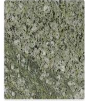
verde kiwi granit

Bergama Granitinin mineralojik yapısında 7 adet kimyasal belirtilmiştir. Oksijen ve silisyum içeren silisyum dioksit, alüminyum oksit, kalsiyum oksit, magnezyum oksit, sodyum oksit, potasyum oksit gibi kimyasal bileşenlerin yüzdesel olarak oranları detaylı bir şekilde aşağıda verilmiştir.